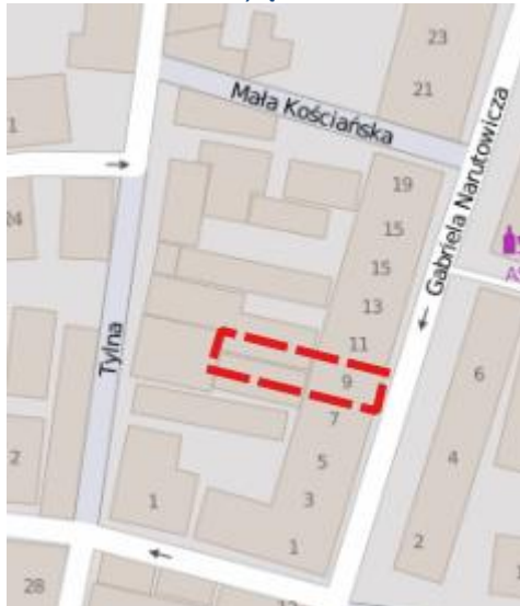
Rysunek 4. Nieruchomość wyłączona z obszaru rewitalizacji.